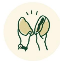
グルテンフリーの おいしい試食体験