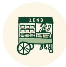
ZENB商品を リアルで購入