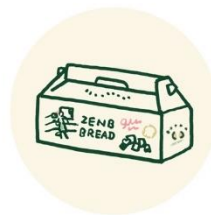
オリジナルギフト 販売