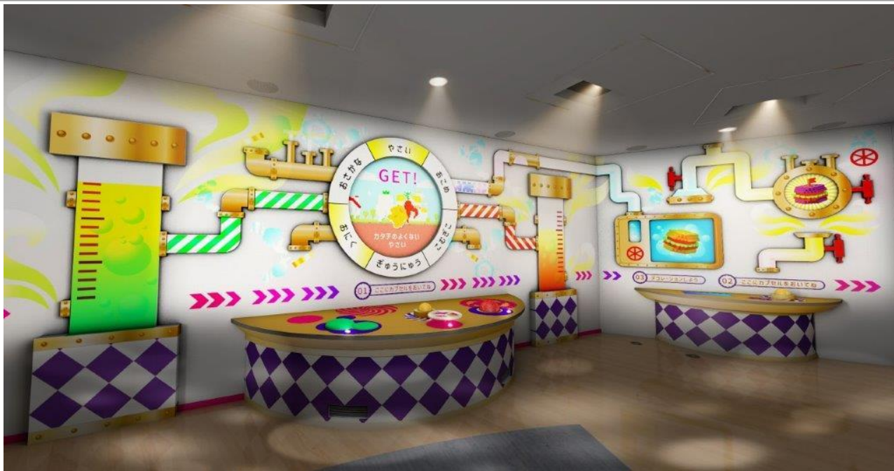
「光の庭」の「そうぞうファクトリー」

～未来の食べものをつかって未来の世界へ届ける！？ デジタルを活用した体験で社会課題を楽しく学ぶ～