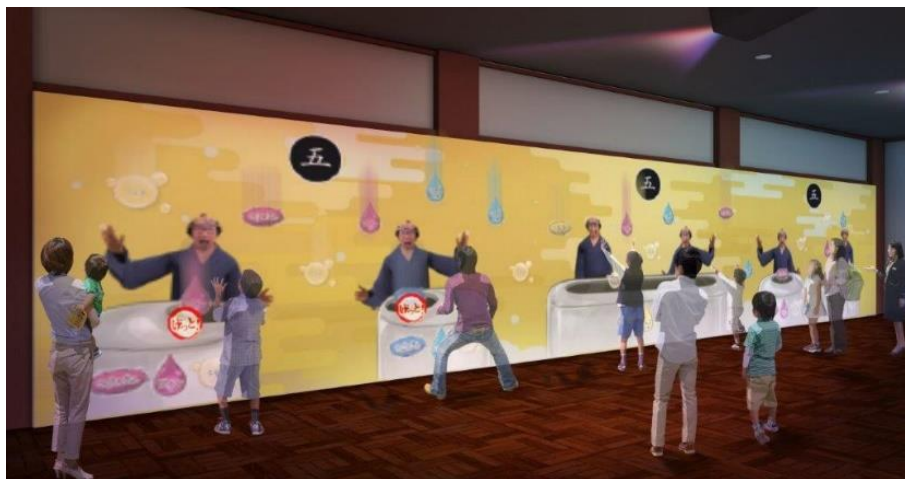
「あなたも酢づくり職人」