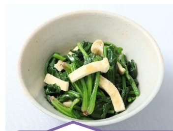
だしまろぽん+ ほうれん草と油揚げのおひたし！