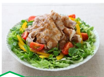
ごまぽん+ 豆苗の冷しゃぶ！

「だしまろぽん ™ 」は、かつおだし・昆布だし・ほたてだしの3種類のだしに、さっぱり風味のぽん酢を合わせた、まろやかな味わいとさっぱりとした後味が特徴です。