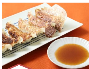
麻辣ぽん+焼き餃子！