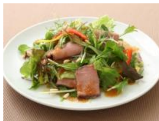
<ローストビーフのサラダ>

2017年春に家庭用の商品として発売された「たまねぎぽん」を、業務用でも発売いたします。「業務用たまねぎぽん」は、たっぷりのたまねぎに、すりおろしたしょうがとにんにくを加え、ゆず果汁で仕上げた、野菜がおいしく食べられる香味野菜入りのぽん酢です。サラダや焼肉、ハンバーグ、お鍋のつけだれとしてもお使いいただけます。