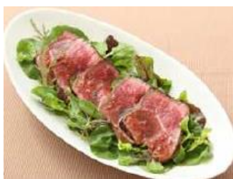
<牛肉のタリアータ>

「パッチョ」シリーズは、彩りや具材感が好評な、かけるだけでカルパッチョやサラダが作れるソースです。