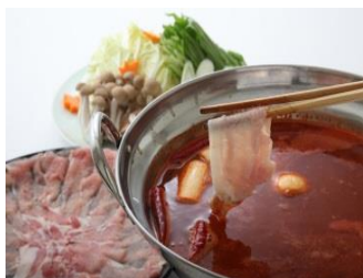
<麻辣しゃぶしゃぶ>

「麺&鍋大陸」シリーズは、鍋も麺も簡単に調理でき、幅広いメニューにお使いいただける濃縮タイプのスープの素です。