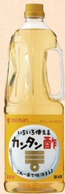
ミツカン カンタン酢™