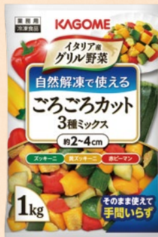
カゴメ 冷凍イタリア産グリル野菜 自然解凍で使えるシリーズ