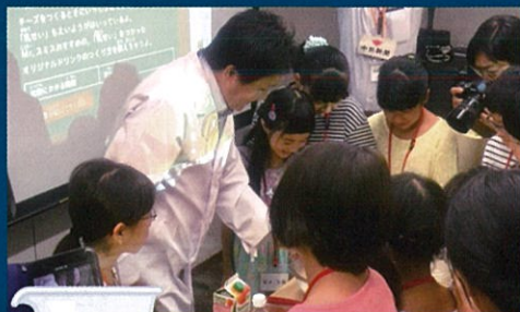
【講師】チームMIM (MIZKAN MUSEUM)

お酢が持っている不思議な力を使って、楽しい実験や体験を通じて楽しく学びます。君も「お酢博士」になろう!!