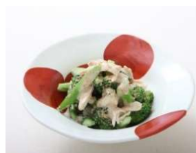
〈蒸し鶏のごま和え〉